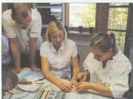
Erste Versuche mit dem Ankylos-System am Plastikkiefer